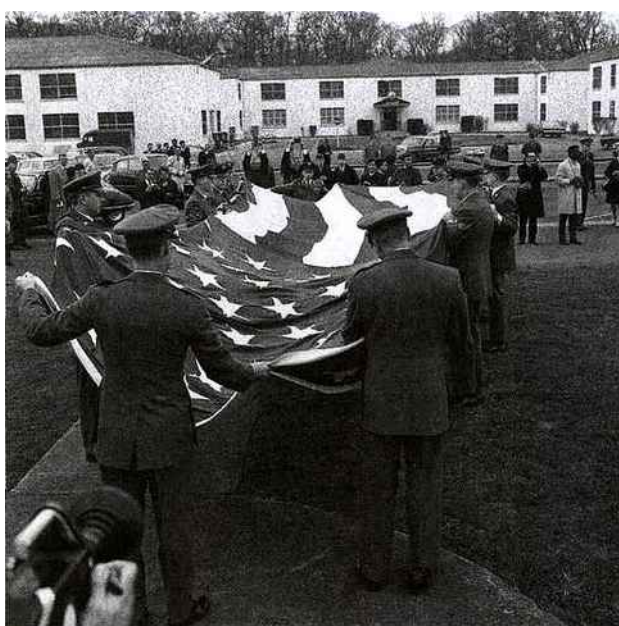
Rupture. Le QG de l'Otan, à Saint-Germain-en-Laye, se prépare à déménager pour Mons, en Belgique.

Mais, pied de nez de l'Histoire, cette bombe était-elle vraiment le produit du retrait de la France de l'Otan ? Huit ans après la rupture de 1966, Valéry Giscard d'Estaing est élu à l'Élysée. L'un de ses premiers visiteurs étrangers n'est autre que Henry Kissinger, secrétaire d'État américain, qu'il reçoit le 5 juillet 1974. Celui-ci vient lui parler des « relations spéciales » existant entre la France et les États-Unis. Le nouveau chef de l'État découvre alors que, malgré tout ce qui s'est raconté, celles-ci ont permis, dans le plus grand secret,